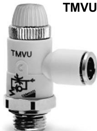
TMVU Fojtó visszacsapó szelep