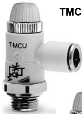
TMCU Fojtó visszacsapó szelep